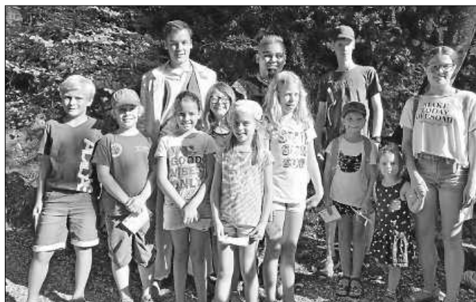
Ein Foto mit Aladin und Dschinni durfte natürlich auch nicht fehlen.

Am vergangenen Samstag besuchten wir im Rahmen des Kinderferienprogramms die Naturbühne Steintäle in Fridingen. Mit insgesamt 16 Teilnehmern starteten wir unseren Ausflug in Dürbheim. In der obersten Reihe durften wir die fabelhafte Kulisse und das Kinderstück „Aladin und die Wunderlampe“ bei strahlendem Sonnenschein bestaunen. Nach ca. 90 Minuten waren wir verzaubert und alle Kinder durften dann noch auf Autogramm jagd gehen.